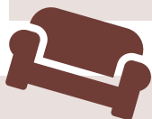
График вывоза по вашему адресу указан в планировщике сбора мусора.

Громоздкие предметы домашнего обихода, которые слишком велики для мусорных баков, забирают и вывозят прямо от входной двери без доплаты. Например, гардеробы и кухонные шкафы, столы, полки, стулья, пустые корзины для мытья посуды, прикроватные тумбочки, матрасы, каркасы кроватей.